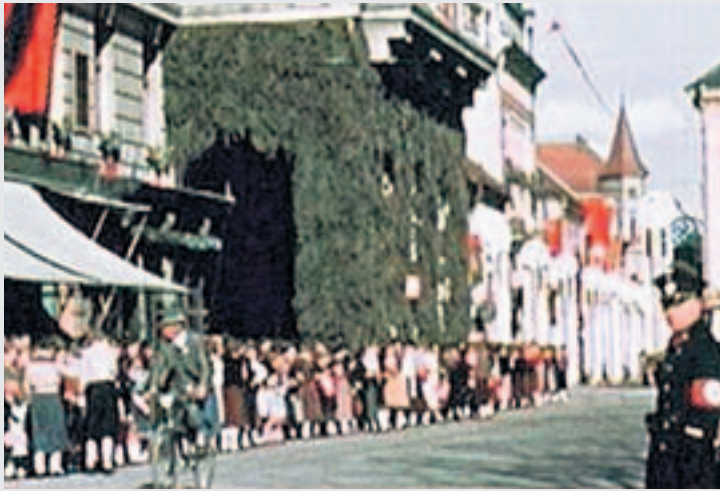
Großes Warten auf den „Führer“: Blick in die Burggasse in Klagenfurt