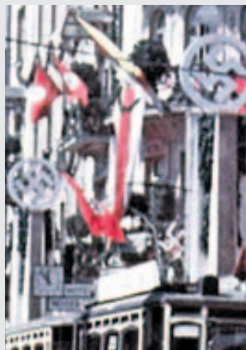
NS-Fassadengestaltung in Klagenfurt