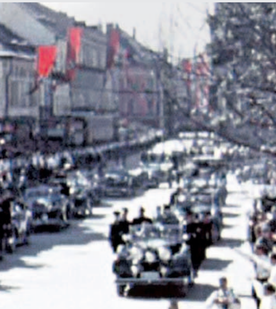
bei der umjubelten Fahrt zum Rathaus der Kärntner Landeshauptstadt