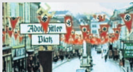
Hurtig umbenannt: der Villacher Hauptplatz

dass das ZDF „seine“ Aufnahmen mit eingearbeitet hat.