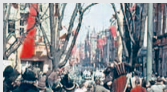
Großer Menschaufmarsch im Klagenfurter Stadtzentrum