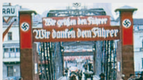
Villach 1938: reich beflaggte Draubrücke